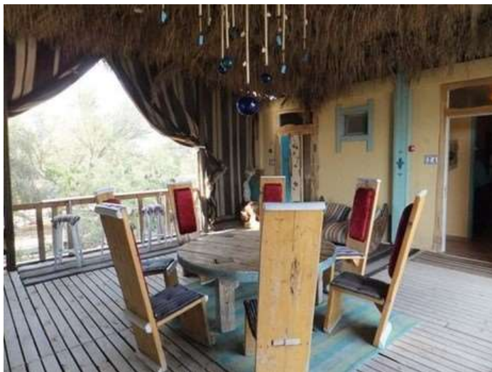
מראה החצר בין החדרים בכפר הנוקדים

כפר הנוקדים נמצא על כביש 3199 היורד מערד לצד המערבי של מצדה, ומתחיל בחלק הצפון מזרחי של העיר, בסמוך להר כידוד. 08-9950097.