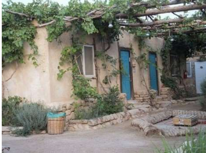
הכניסה לחדרים בכפר הנוקדים