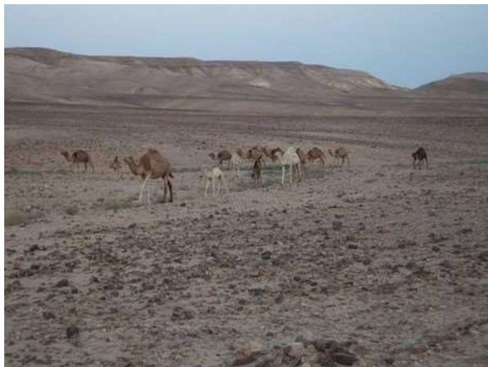
שיירת גמלים בלב המדבר

"יש חתונה אצל הבדואים. החגיגות נמשכות שבוע ימים, ומדי ערב מתכנסים הגברים בצוותא לשיר לכבוד החתן", מסביר לי מתי, אחד מאנשי כפר הנוקדים. "בסמוך, מתקיימת חגיגת הנשים לכבוד הכלה". מתנתקים מהחושך וחוזרים אל מעגל האור. "אגב, החשמל שמגיע מהגרנטור כאן יקר לאין שיעור ממחירו בעיר", המשיך לתאר את הפלא המואר בנאות המדבר.