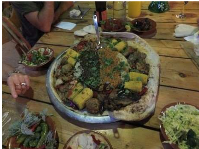
ארוחת הערב המוגשת מעל האמפיתאטרון

מסלול נוסף מוליך את המטייל אל ליבו של מדבר יהודה , מעל קניון מדהים. גבעת גורני שמזדקרת ברמת מדבר יהודה, צופה אל נוף קדומים של נחל צאלים. מפל השפן, ורחוק יותר מפל צאלים הכביר. מכאן רמת המדבר נראית כנוף קדומים החרוץ בסחם של המים והרוחות. לקראת שקיעה, גוני הזהב נושקים למדבר בפרידה, נוסעים על דרך העפר הארוכה (שביל נחל לכל רכב) לכיוון מצפה מיוחד.